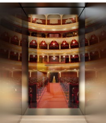
Haushahn Ahead Smart-Mirror On

Den Haushahn Ahead SmartMirror befüllen Sie ausgesprochen einfach mit Content: Über das webbasierte und benutzerfreundliche CMS stellen Sie ausgewählte Inhalte in Echtzeit und aus der Ferne auf den Screen. Für jeden Haushahn Ahead SmartMirror definieren Sie eine eigene Playlist und stimmen die Inhalte auf die Tageszeit, auf geplante Sonderaktionen oder das Wetter ab.